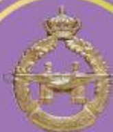
Basistembleem KLD