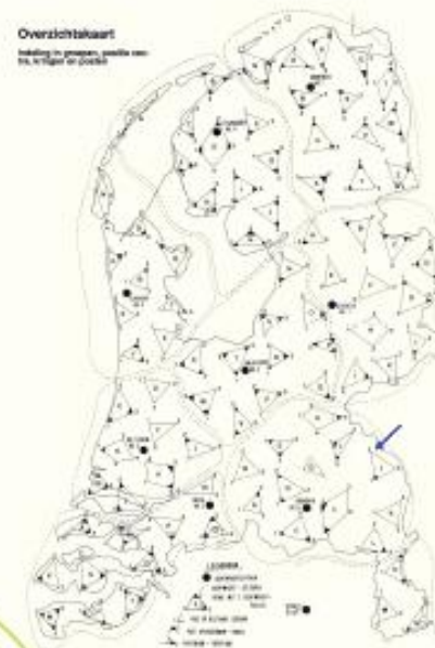
Alle 276 luchtwachtposten in kringen, bij de pijl Maashees