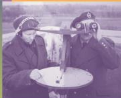
Luchtwachters op een toren veld in het land