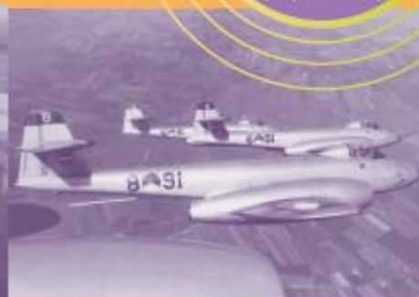
Tijdens oefeningen waren Meteors van de Koninklijke Luchtmacht te zien