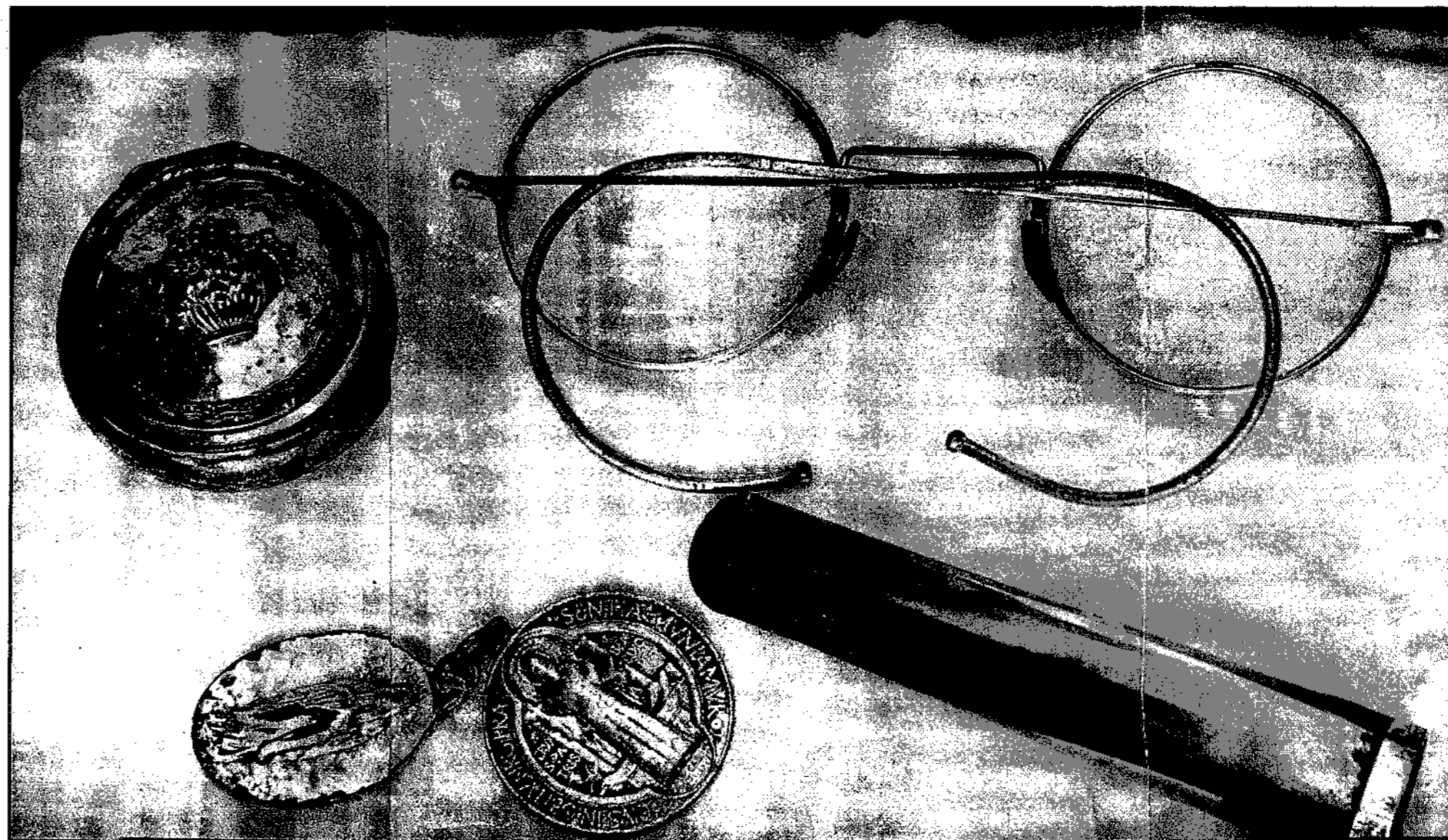
Bij het opgraven van het gebeente vond Jan Cremers (olier) snel achtereenvolgende voorwerpen die onmiskenbaar aan de pastoor hadden toebehoord: een hostiedoosje, een bril, een sigarepijpje, een paar medailles.

Kapelaan Hurkmans is nu pastoor in Endhoven. Hij zegt dat er „in de loop van de jaren een sterke legendevorming is opgetreden” en vertelt mij het volgende verhaal: „Op 26 september werden we in Vierlingsbeek flink beschoten door de geallieerde artillerie. De Duitsers waren zeer gespannen en ontzettend